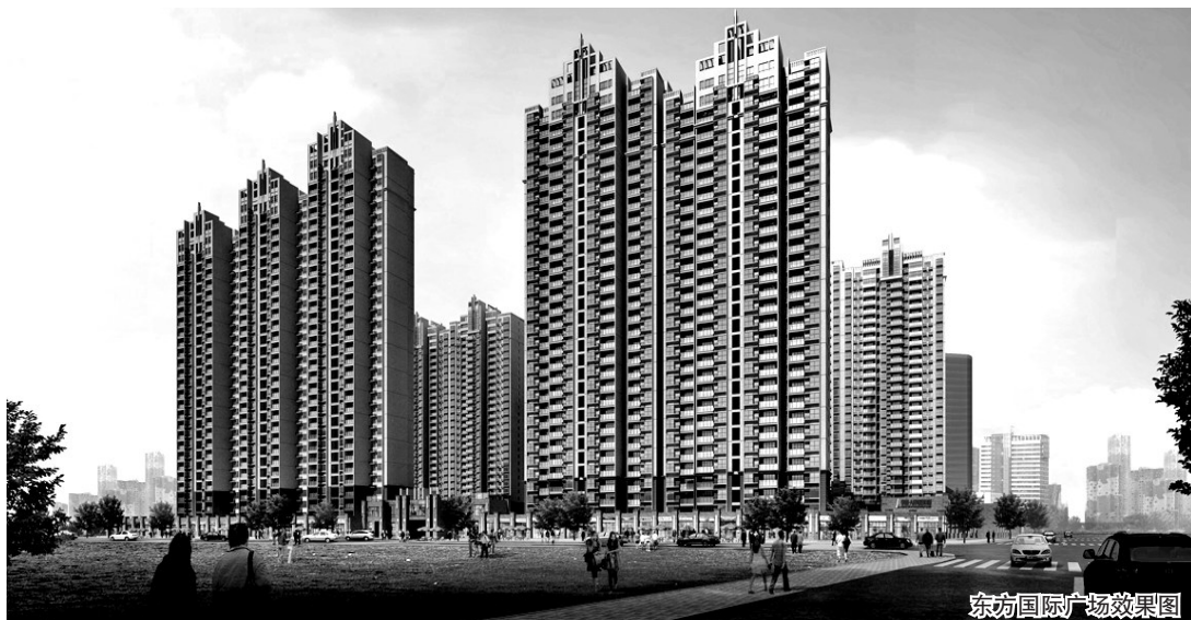
东方国际广场效果图