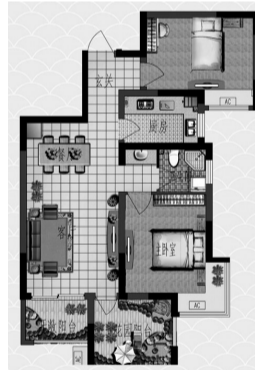
两居室 建筑面积:91.48平方米

该项目为正在销售的两房产品,双卧室朝南,让阳光无处不在;飘窗设计,提升居住者的视觉享受,尽享愉悦心情;客厅与开放阳台以及花园阳台相连,美景无限。