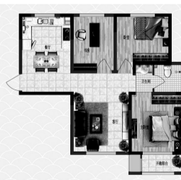
三居室 建筑面积:90.52平方米

从户型图上可见,这套三居室功能区分合理,全明通透,会客、休息互不打扰。主卧空间开阔,朝南面向,既保证采光又亲和自然;卫生间干湿分离设计,有效提升居家生活的舒适度;卧室与开放阳台相连,室内生活与外部景致相融合,让生活品质无限延伸。