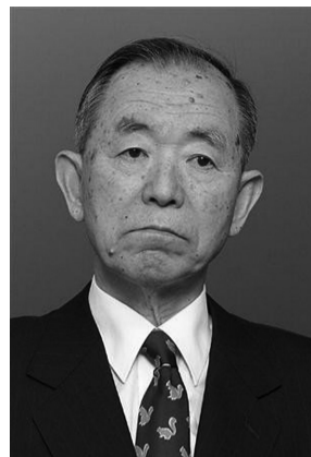
丹羽宇一郎资料图