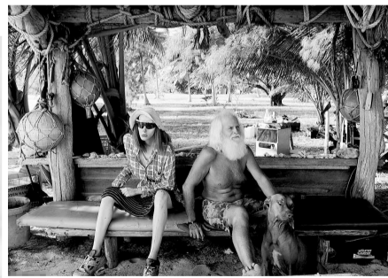
格拉欣与“模拟女友”。