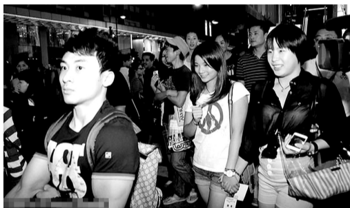
中国奥运金牌运动员于24日-26日在香港出席庆功宴及交流活动。其间,大部分运动员在25日晚出外购物,收获颇丰。