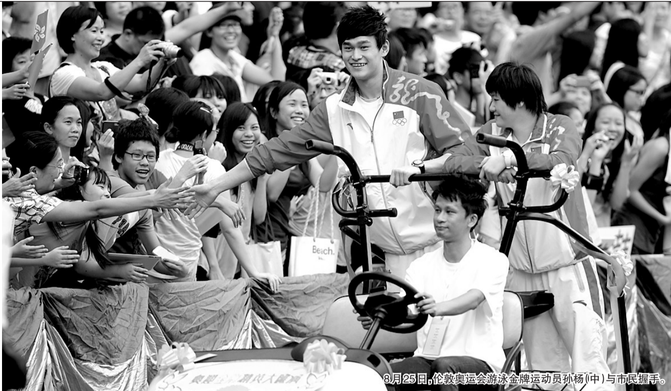
8月25日,伦敦奥运会游泳金牌运动员孙杨(中)与市民握手。

东莞市委和市政府 向中国羽毛球队赠送100万元慰问金;当地5家企业一共赠送770万元奖金 某汽车公司 赠送伦敦奥运会首金得主易思玲一辆豪车 浙江某房地产公司 奖励孙杨和叶诗文价值300万元的别墅 青岛某房地产企业 奖励张继科价值300万元的海景房 陕西省 奖励秦凯90万元,奖励郭文珺60万元 云南省 奖励陈定100万元 江苏省 奖励陈若琳60万元,南通市另外再奖励120万元 北京市 奖励将不低于100万元 广东省 每人重奖500万元另加豪车一辆