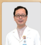
韩国整形泰斗 宣旭博士