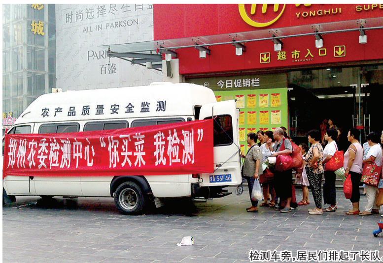
检测车旁，居民们排起了长队。