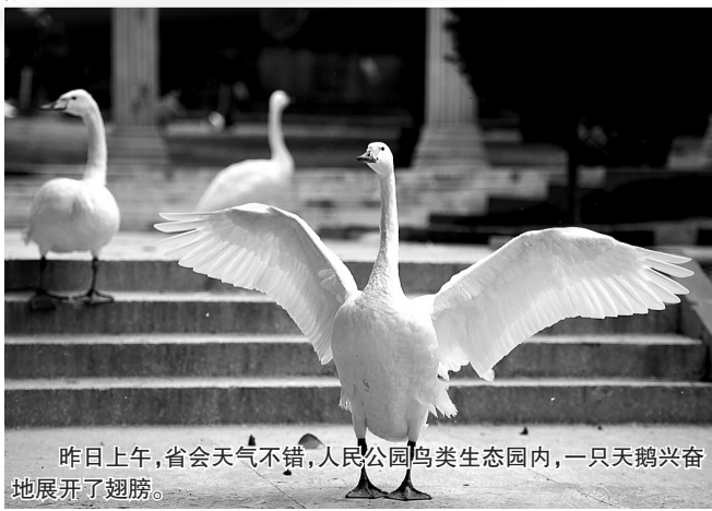
昨日上午,省会天气不错,人民公园鸟类生态园内,一只天鹅兴奋地展开了翅膀。