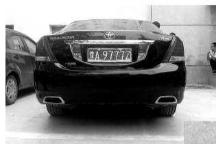
修好的皇冠车,受损的前牌被换到了后面

昨日,交巡警四大队高磊来电称,经过多日调查取证,于8月24日发生在城东路的重大的交通事故逃逸案成功告破。 记者 张玉东 立/陶