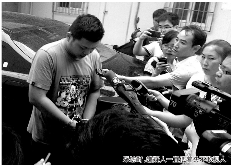
采访前,嫌疑人一直低着头不敢视人