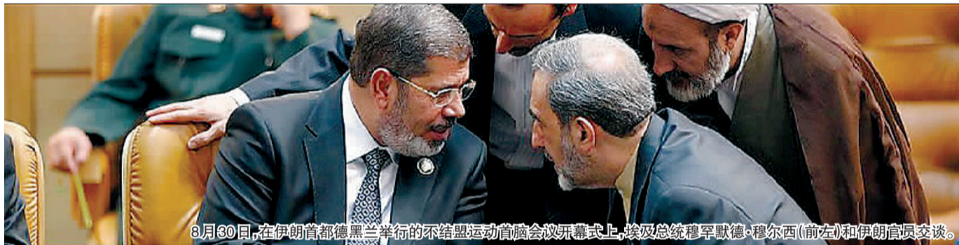
8月30日,在伊朗首都德黑兰举行的不结盟运动首脑会议开幕式上,埃及总统穆罕默德·穆尔西(前左)和伊朗官员交谈。

中国地震台网测定震级为7.6级,震源深度30公里。菲律宾地震局局长索里杜姆表示,已经建议萨马岛沿海居民撤退到地势较高地区。 本报综合