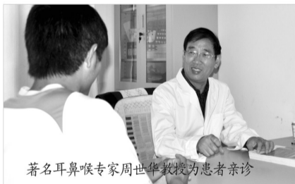
著名耳鼻喉专家周世华教授为患者亲诊

据河南曙光医院院长邢军介绍,本次鼻咽癌疾病免费筛查及大型专家会诊活动于9月6日正式启动,平日若有频繁打喷嚏、流鼻涕、鼻塞、流鼻血、头部闷痛、嗅觉衰退、记忆力下