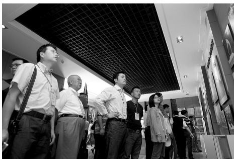
全国晚报总编、记者在大连采访