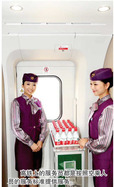
高铁上的服务员都是按照空乘人员的服务标准提供服务。

昨日,部分媒体及网友代表亲身体验了在这辆石武高铁新型动车CRH380AL上,坐着价值23万元的“蛋舱”座椅,享受到“空姐”标准的乘务员的热情服务,不少体验者高呼过瘾。 记者 李雪/文