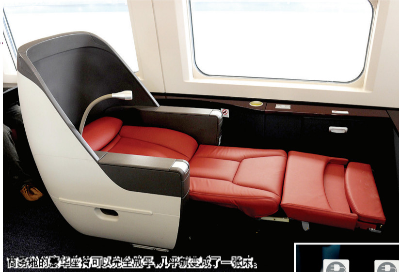
向左侧的豪华座椅可以完全放平,几乎就变成了一张床。