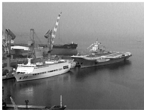
23日,16号舰与相邻停泊的88号舰全部挂满旗

22日早晨不到7点,甲板清扫完毕。穿着白色海军制服的军人开始走上甲板。记者惊奇地发现,他们中有几十名是戴卷檐帽的女海军战士。