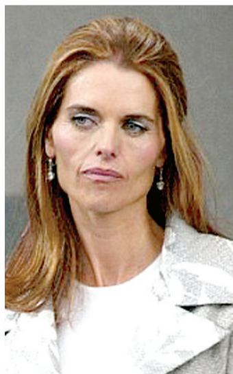
施瓦辛格的妻子玛丽亚·施赖弗

由于觉得对巴艾娜和私生子心怀愧疚,施瓦辛格从那之后就对巴艾娜变得“十分慷慨”,立即将巴艾娜的工资涨到了每周1200美元。不久之后,巴艾娜和丈夫离了婚,而她则继续独自抚养施瓦辛格的私生子和另外3个孩子。书中披露,10多年来,施瓦辛格一直将他和女佣巴艾娜生有一名私生子的事情当作“最高机密”,不敢向妻子玛丽亚走漏半点风声。