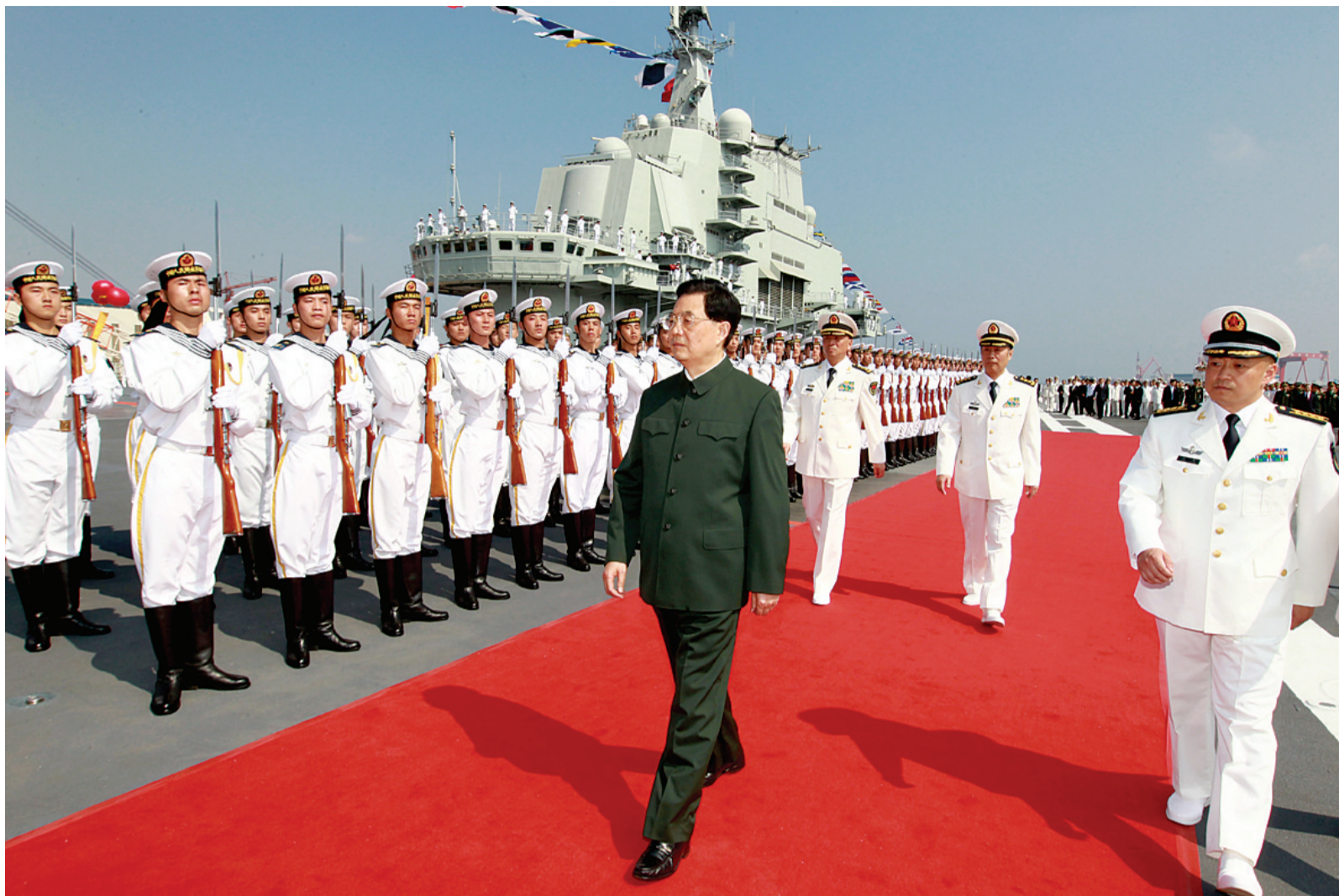
仪式结束后，胡锦涛健步登上“辽宁舰”，检阅海军仪仗队。