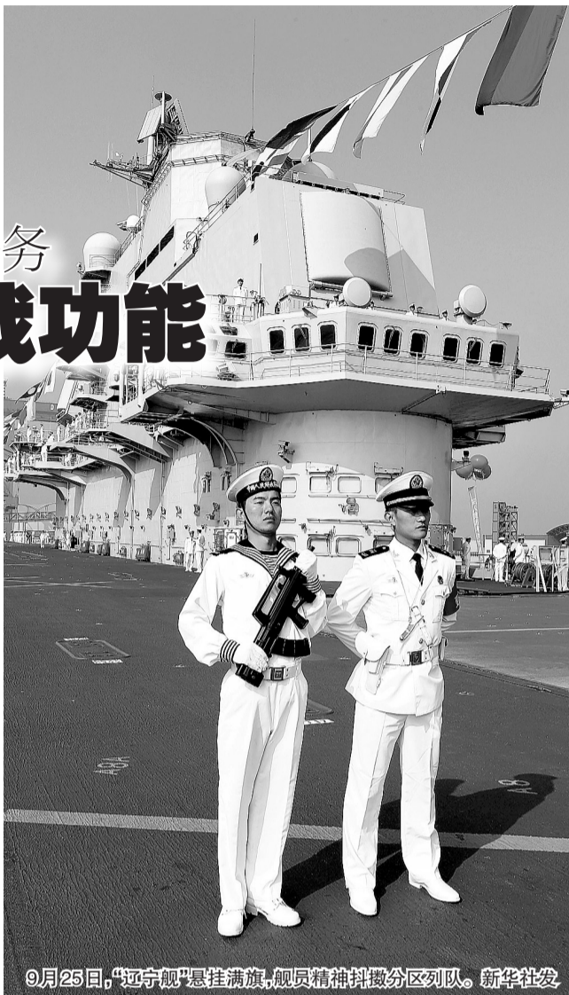
9月25日,“辽宁舰”悬挂满旗,舰员精神抖擞分区列队。

他同时强调,虽然目前“辽宁舰”的主要任务仍然是训练和科研,但在必要时候它也可以具备作战功能,为维护国家主权和领土完整提供有利平台。