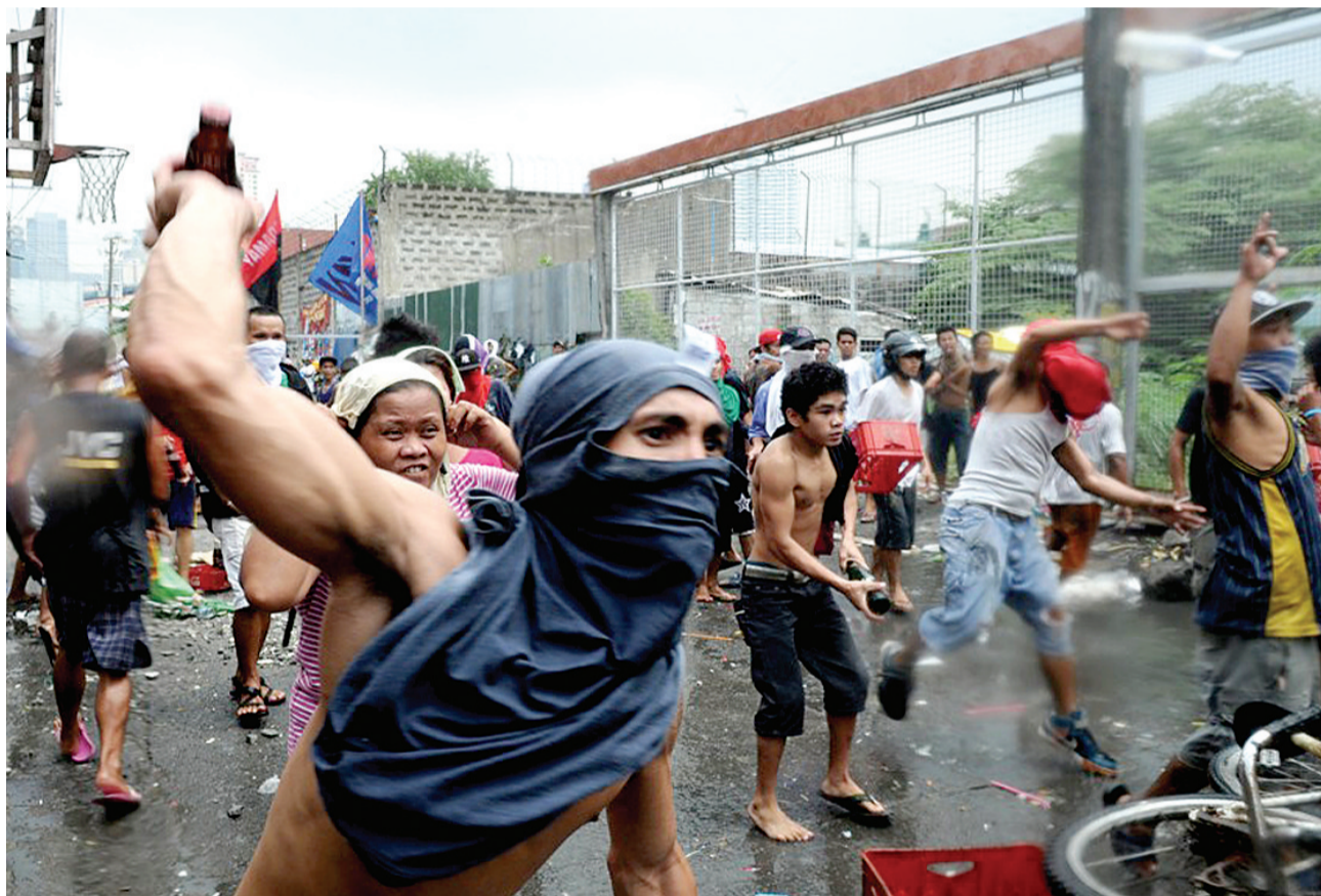
当地时间9月24日,菲律宾马尼拉,施行拆迁的工作人员在进行拆除工作时受到棚户区居民的阻挠,双方发生冲突,棚户区居民向工作人员及警察投掷石块,警察向棚户区居民发射水枪。图为冲突现场,共造成7名棚户区居民受伤,6名警察和1名摄像师也在其中受伤。