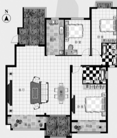
建筑面积: 163.98平方米 三房两厅两卫

这是一套舒适三房,南北通透、动静分区,尽显家族生活风范;私家入户花园、阳台、露台组合,让视野更加开阔,与景相融。