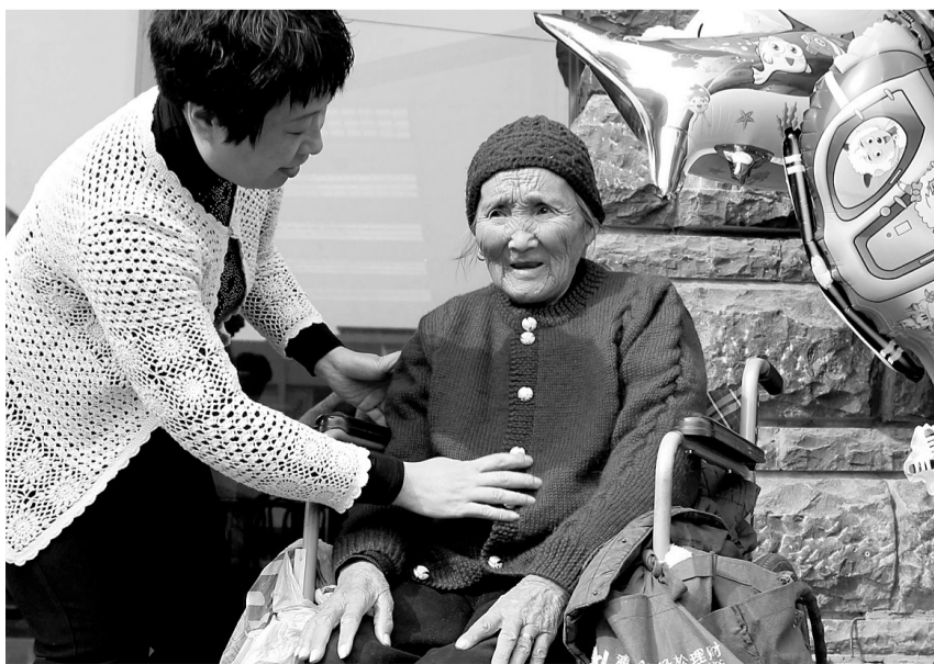
织的毛衣挺合身的