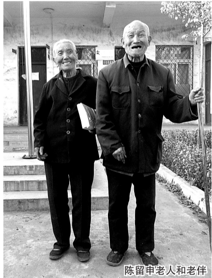
陈留申老人和老伴