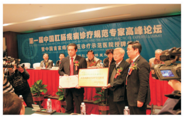
● 第一届中国肛肠疾病诊疗规范专家高峰论坛上,中国肛肠病研究院授予郑州肛泰肛肠医院“中国首家痔瘡规范诊疗示范医院”荣誉称号,原卫生部副部长孙隆椿为郑州肛泰肛肠医院颁发荣誉奖牌。