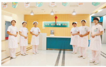
● 郑州肛泰肛肠医院全体医护人员以100%责任心确保肛肠检查100%精确