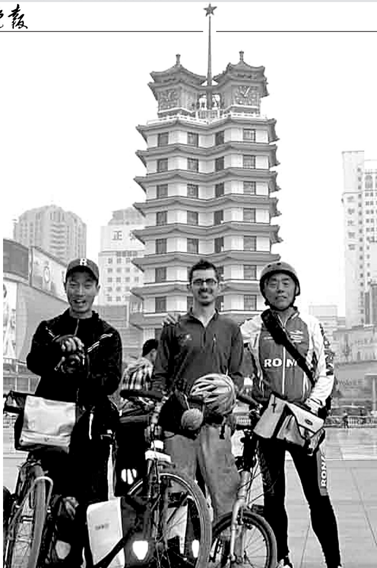
美国、韩国、中国郑州骑友二七塔前合影留念