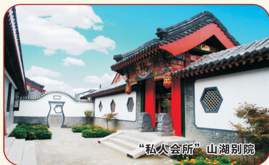
“私人会所”山湖别院