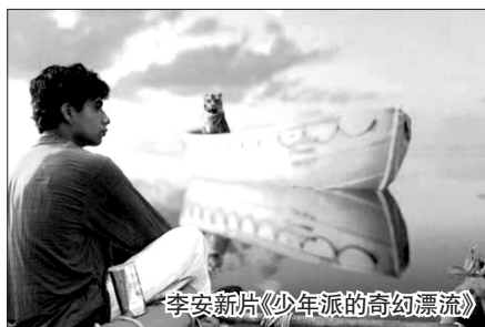
李安新作《少年派的奇幻漂流》