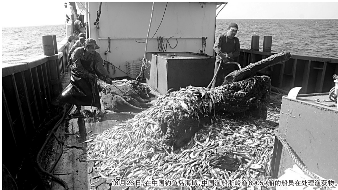
10月26日,在中国钓鱼岛海域,中国渔船浙岭渔69059的船员在处理渔获物。

外交部副部长张志军26日举行中外媒体吹风会,就钓鱼岛问题和中日关系阐述了中方立场和主张,并回答记者提问。