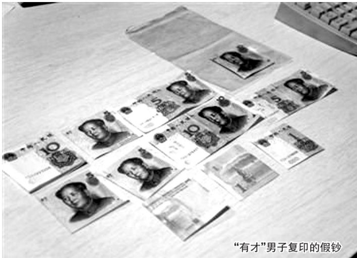
“有才”男子复印的假钞