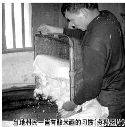
当地村民一直有酿米酒的习惯(资料图片)