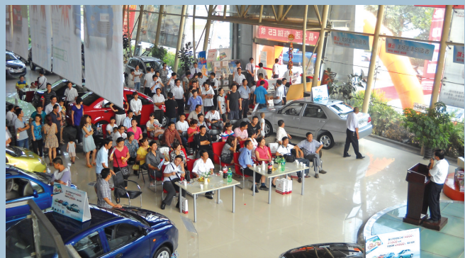
【诺亚方舟购车计划】

实际上,中原汽车市场许多汽车厂家及经销商已经推出过诸如“零首付”、“送装饰”、“送保险”等促销方式,这在某种意义上也是把汽车当做一般商品进行促销,标志着中原汽车消费在走向打折时代。