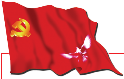
满怀信心喜迎党的十八大