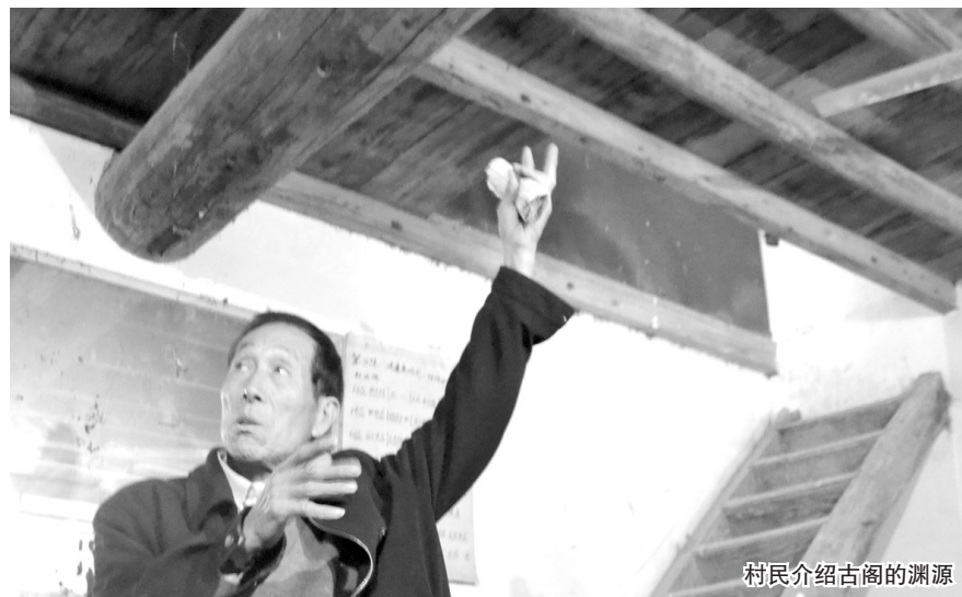
村民介绍古阁的渊源