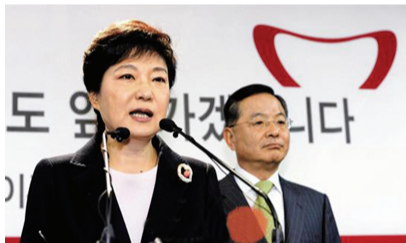
朴槿惠6日在首尔汝矣岛新国家党总部与政治改革特委委员长安大熙一起在发表政治改革方案。

韩国新国家党总统候选人朴槿惠7日指责最大在野党候选人文在寅和独立候选人安哲秀联手参选是无关民众生活的“作秀”。