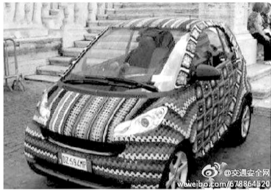
@交通安全网:天冷了,赶紧给爱车织件毛衣吧。