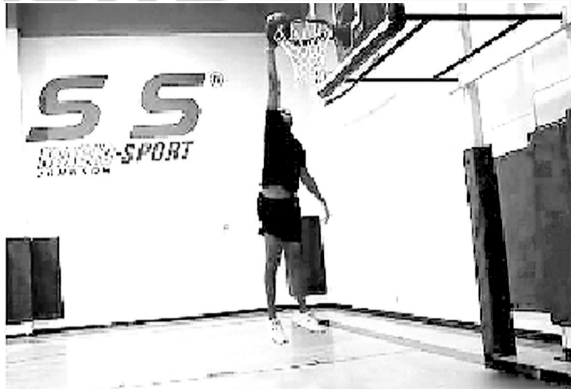
从约翰逊扣篮截屏图可见,56岁的大伯明显体态臃肿,能飞起来实属不易。

马库斯·约翰逊这个名字对于大部分中国年轻球迷来说都很陌生,因为1989年他就已经退役了。这位5届NBA全明星球员现在是福克斯电视台的篮球比赛评论专家,他不只是光动动嘴皮子,是真心相信,自己还能飞。