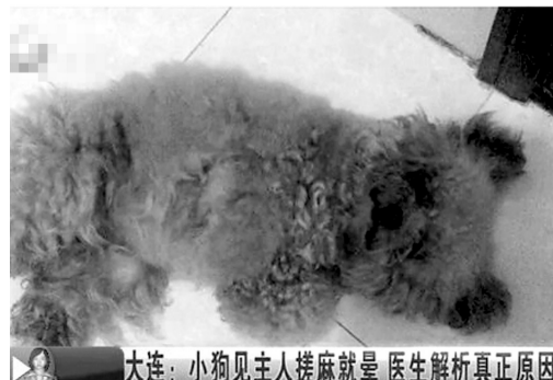
大连:小狗见主人搓麻将就晕 医生解析真正原因