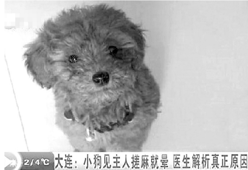
大连:小狗见主人搓麻将就晕 医生解析真正原因