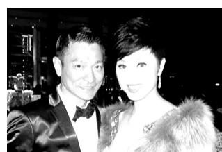
八卦方向:怀旧 陈法蓉&刘德华 20年后的龙九与陈刀仔

近日,庚澄庆再度在微博中贴出了与吴莫愁的录音棚合照,两人都戴着黑框眼镜,留着齐刘海的发型,呆萌地看着镜头,庚澄庆还在微博中写道:“帮@吴墨愁Momo(吴莫愁的微博名)录完音!当时我们震惊了!是太好听了?还是饿了?”两人的表情实在萌翻了一众网友,纷纷留言称:“好般配啊!”、“不要亵渎,这是纯洁的师生恋!”