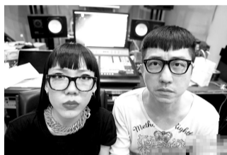
八卦方向:绯闻 庚澄庆&吴莫愁 卖萌被指很般配

自从明星玩上了微博,晒私密生活已成常态,明星自拍也是随处可见,见惯不怪了。不过,明星与明星的合照倒是时常能引来不少八卦谈资,这不庚澄庆与吴莫愁的卖萌合照,陈法蓉与刘德华再聚首,以及范冰冰与任志强的偶遇等都引来大量关注,当然亮点可全在评论中,这其实也在传递一个微博时代的八卦要点:别放过评论。