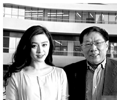
八卦方向:全方位 范冰冰&任志强

演员陈法蓉近日在微博中晒出一张与刘德华的合影,还跟好友蔡少芬称“自己都羡慕自己”。这张合照令不少网友回忆起1991年刘德华与周星驰主演的《赌侠》,饰演龙九的陈法蓉与刘德华饰演的陈刀仔属于战斗中绽开爱情之花的搭档,当年在影片中陈法蓉对华仔的频频示爱毫不给面子。有网友翻出了二人在片中的合照,不少人纷纷在评论中感叹:“20年弹指一挥间,这就是多年后的陈刀仔和龙九”。