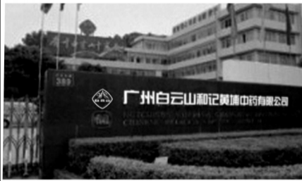
咳喘根源被发现——沥青般的痰栓

特别提示 2004年5月,华人巨富斥巨资1.7亿,联合国内最权威的中药制药企业广州白云山集团,成立了“广州白云山和记黄埔中药有限公司”。并由钟南山院士领衔,共同组建了我国国家级呼吸疾病重点实验室,国内哮喘病治疗领域新标杆向白云山看齐!白云山紫茶颗粒正是由钟南山领衔的国家级呼吸疾病重点实验室研制,国内首个能彻底根治老慢支肺炎喘咳的专用新药。它的问世轰动整个医学界,它显著的治疗效果令世界呼吸疾病防治领域的专家大加赞扬,它让哮喘患者摆脱了久治不愈、反复发作的痛苦生活。被称为“具有历史意义的一刻”,国内外著名媒体更是用“让医学专家如释重负,划时代新药”等醒目文字来做重点报道。