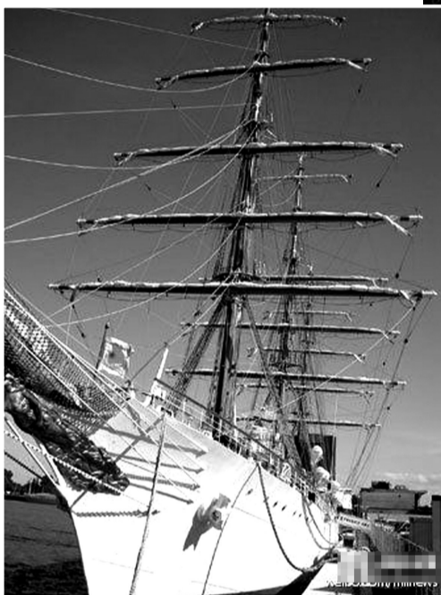
“自由号”教学护卫舰

欠债还钱，天经地义。不还？那就扣点东西让你还钱。最近，阿根廷和加纳就唱了这么一出戏：一个是欠了美国公司一大笔债的“债务人”，一个是替美国追债的“讨债公司”。只是，这被扣的东西竟是一艘护卫舰，恐怕是前所未有的史上头一遭。