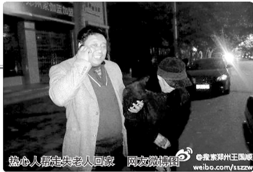
热心人帮走失老人回家