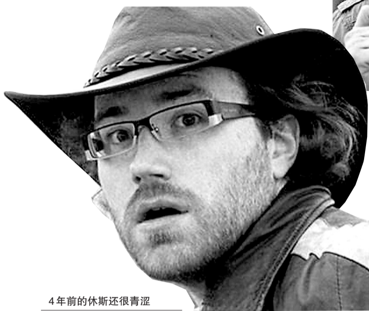
4年前的休斯还很青涩

不过,对休斯来说,最大收获不只在创造一项吉尼斯新纪录,还在于对人性善良的重新确认。