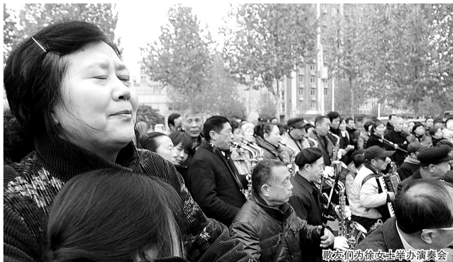
歌友们为徐女士举办演奏会