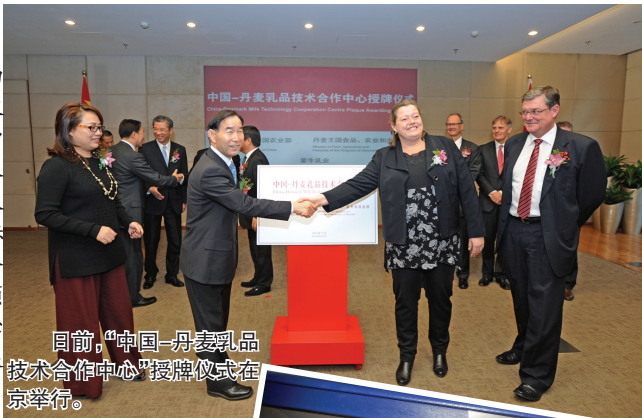
目前,“中国-丹麦乳品技术合作中心”授牌仪式在京举行。

11月26日,由中国与丹麦两国农业部组建的“中国-丹麦乳品技术合作中心”授牌仪式在京举行,这标志着中丹两国首个乳业国家级合作项目正式运营,中心将就两国乳业发展展开深度合作。