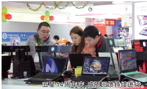
五星14周年庆,感恩回馈持续进行。

最近,不少媒体报道了菜农们买菜难的问题,为帮助菜农解决实际问题,同时也为了回馈郑州市民对五星电器的厚爱,本周末,河南五星电器哥们店将已购买的1万斤白菜免费派送。 记者 樊无敌/文