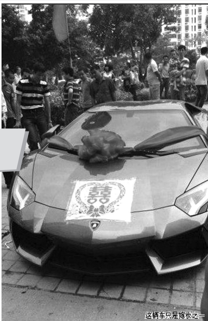
这辆车只是嫁妆之一

“晋江百宏集团老板嫁女儿，嫁妆2亿元，再次刷新了福建嫁女纪录！”这两天，类似的信息频频出现在微博及福建本地一些知名论坛上。福建晋江频频出现“天价嫁妆”。去年，晋江恒安集团许连捷侄女出嫁时，高达1.4亿元的嫁妆让人大开眼界。这次，百宏集团老板嫁女儿，再次刷新了“天价嫁妆”纪录。高达2亿元的嫁妆，想不让人关注都难。一时间，“抢银行，不如娶个晋江新娘”再次成为热门话题。