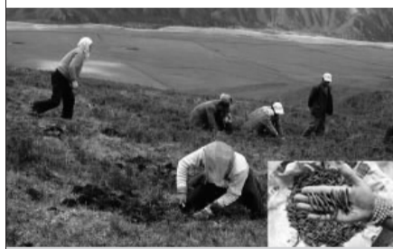
——西藏冬虫夏草采挖现场

得几种病吃几种药,多种药混合吃,是一直沿袭的传统治病方式,几千年似乎无人敢于推翻。但一些名贵中草药的确具有一药治多病的功效,冬虫夏草就是人所共知的一药治多病珍稀药材。它被誉为“百药之王”,能迅速提升全身免疫力,对于多种慢性疾病都具有十分良好的医治功效。要想无病不衰老,首先得从自身免疫力上下功夫,而冬虫夏草就一直有着“免疫之王”的称号,比吃任何其他药品、保健品都要好。——中医中药科学研究院