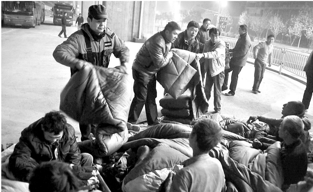
网友为农民工送棉被