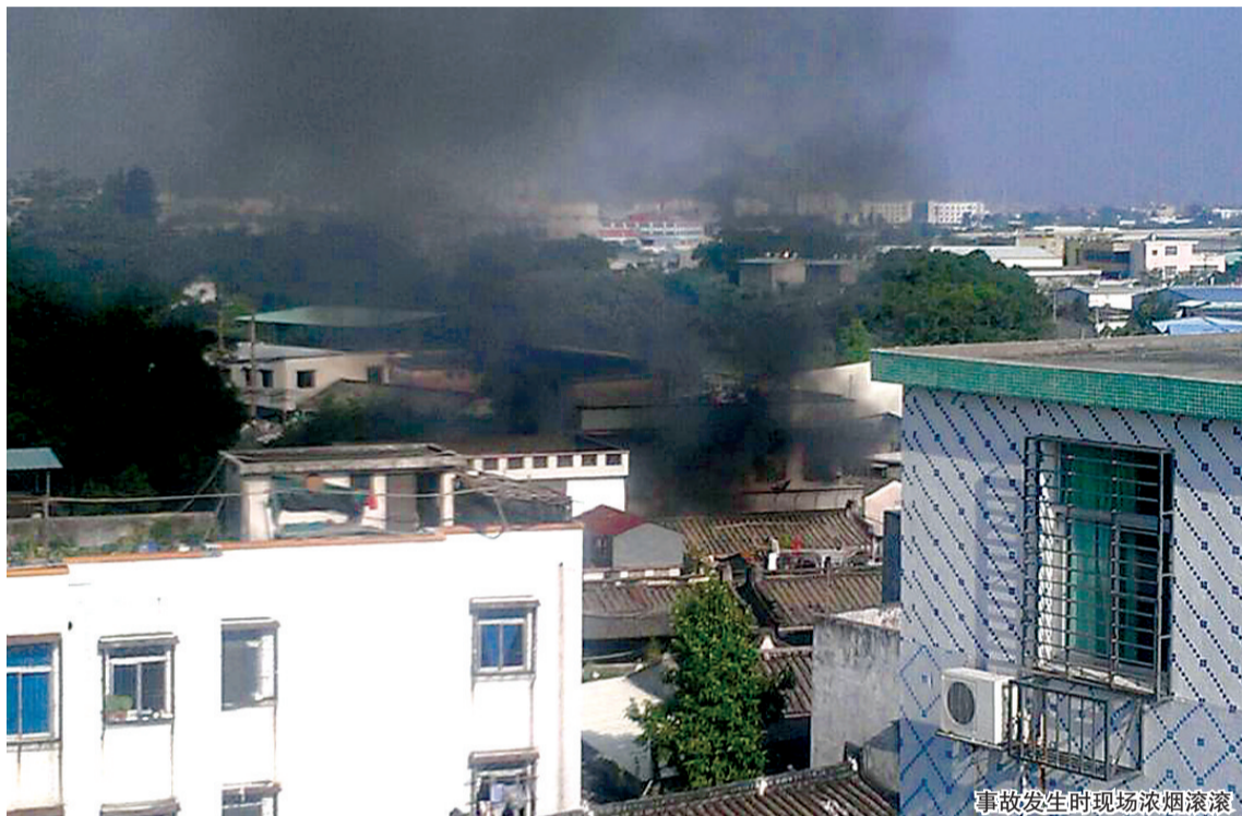
事故发生时现场浓烟滚滚