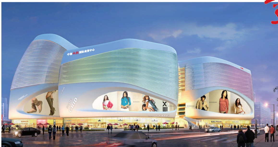
新颖的立面设计,流畅的动线 排布,智能化的城市综合体