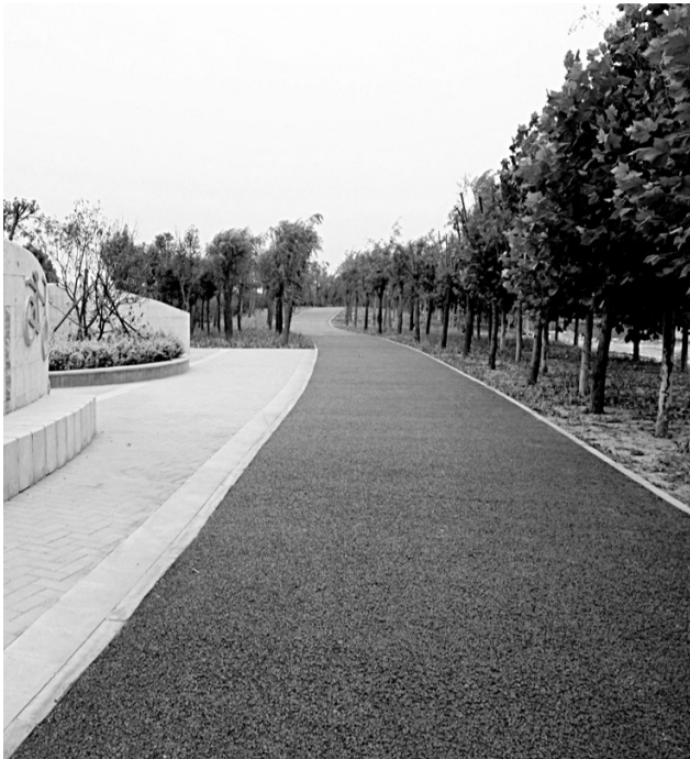
高新区西四环一处绿化示范带