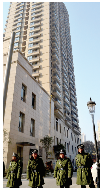
几名保安挡着现场，不让记者靠近。