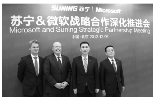
SUNING 苏宁 | Microsoft 苏宁 & 微软战略合作深化推进会 Microsoft and Suning Strategic Partnership Meeting 中国·北京 2012.12.06