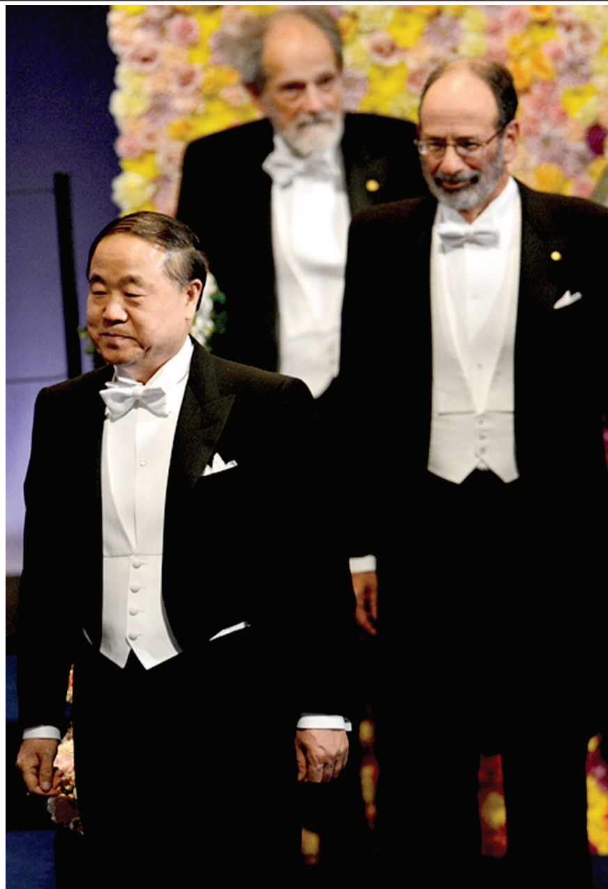
莫言身着黑色燕尾服步入斯德哥尔摩音乐厅。

12月10日是瑞典工业家诺贝尔的逝世纪念日，每年的诺贝尔奖颁奖典礼都安排在这一天举行。