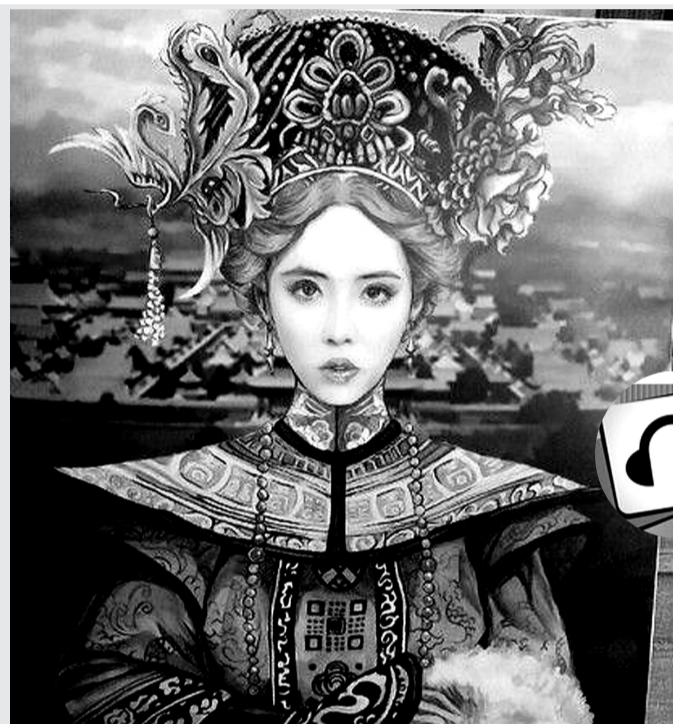
蔡依林:本宫现可真乏了,工作多个时辰都快翻白眼了!但望着这幅画,便想到本宫“登基”之日指日可待,就窃笑了一响。好画!

怀疑与质疑不同,怀疑可以没有逻辑,一惊一乍;质疑必须得有逻辑,鸣锣开仗。假如一个人真的要质疑嫣然天使基金,当然要查询账目,找到一些人证、物证才能大言不惭。一无所有地拿怀疑发难,喋喋不休,很显然就是以抹黑为目的。对于常常困扰于此的明星们,王菲式的打岔可以参考,哈文式的老到值得学习。再遇到传闻来袭,求证如山,无心理会的就开玩笑,有心接招的就了解清楚——这是谁说的,何时何地以及经过结果。